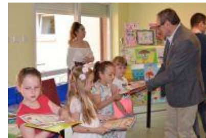
fol. Towarzystwo Przyjaciół Dzieci Oddział Miejski w Wągrowcu