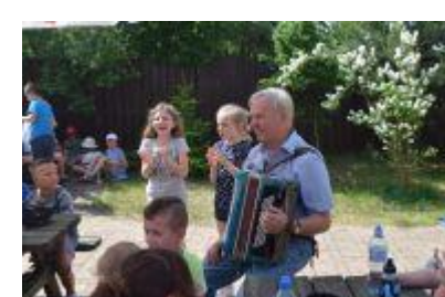
fol. Towarzystwo Przyjaciół Dzieci Oddział Miejski w Wągrowcu