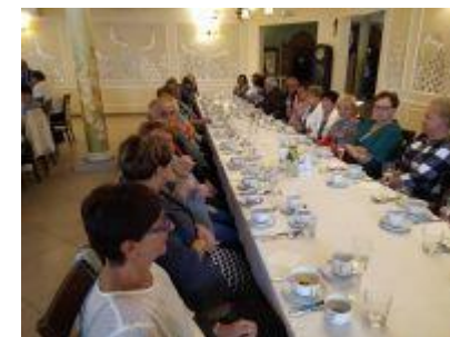
fot. Oddział Rejonowy Polskiego Związku Emerytów, Rencistów i Inwalidów w Skokach