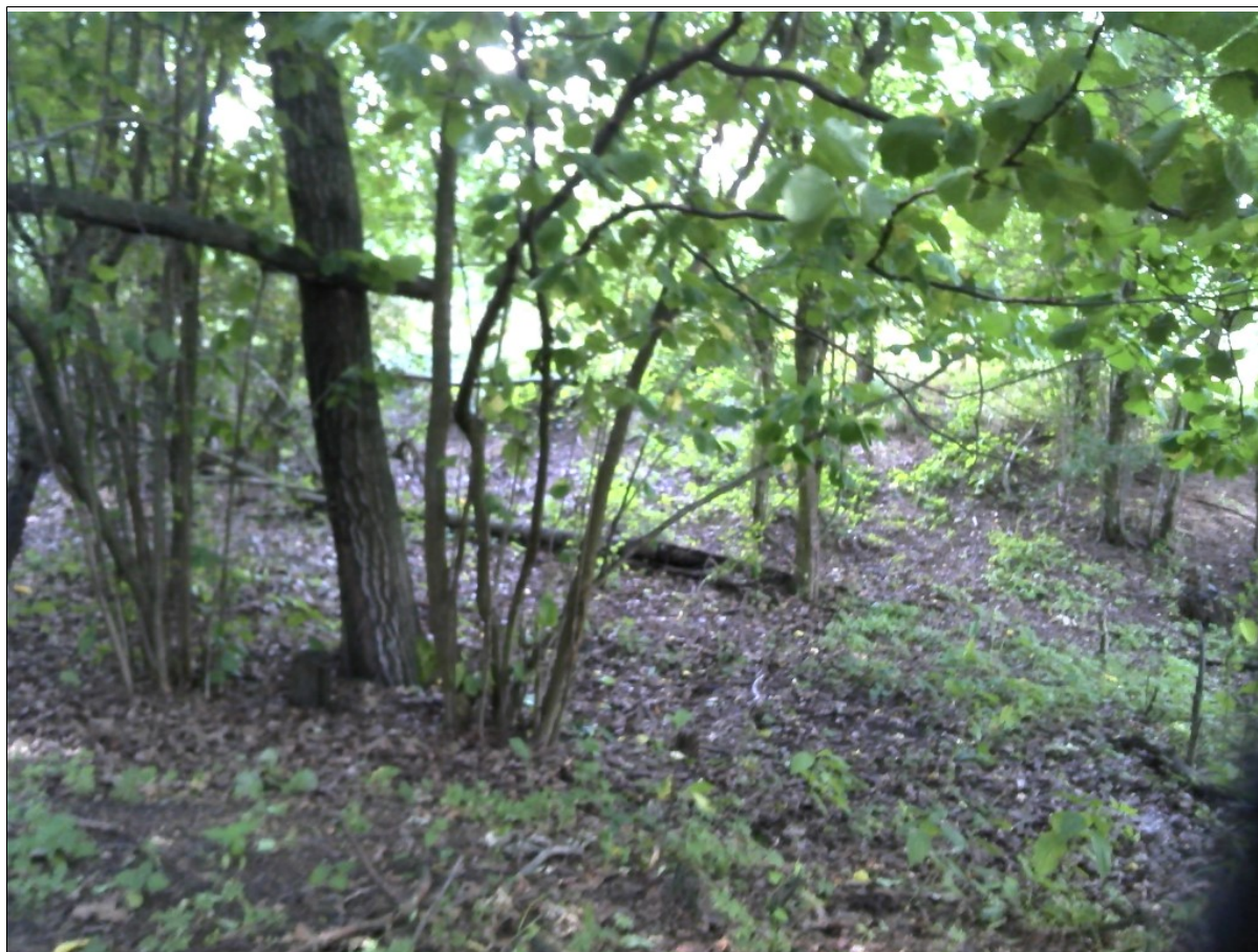
widok na koluwia