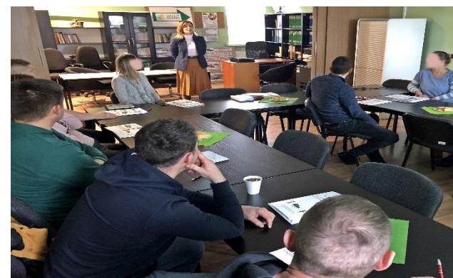
fol. Towarzystwo Społeczno - Prawne w Wągrowcu