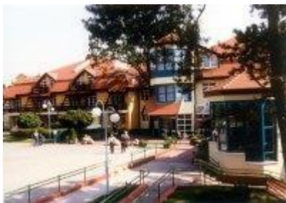
Ośrodek Rehabilitacyjny Wielspin w Wągrowcu

Przeprowadzono 1 kontrolę w sezonie letnim 2022. Obiekt przystosowany do rodzaju prowadzonej działalności. Stan sanitarny bez uwag, urządzenia sprawne. Obiekt można zaliczyć do wyróżniających się pod względem sanitarnym i technicznym.