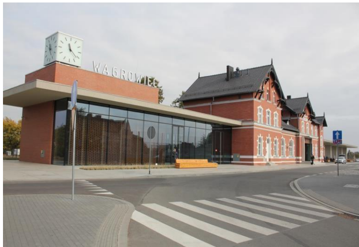
Dworzec kolejowy w Wągrowcu po modernizacji.

Przystanki kolejowe - bez obsady osobowej. Perony wyposażone w wiaty przystankowe, ławki oraz kosze na śmieci. Stan sanitarny nie budził zastrzeżeń.