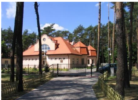
Hospicjum Św. Samarytanina w Wągrowcu