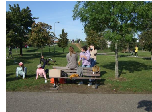
fol. Towarzystwo Przyjaciół Dzieci Oddział Miejski w Wągrowcu